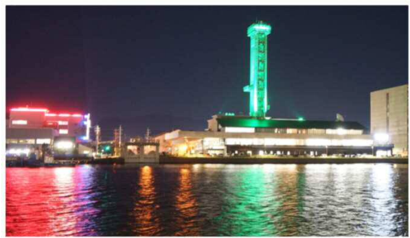
さんいん中央テレビ鉄塔 10月15日～16日