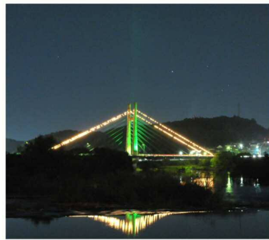
雲南市 木次大橋 10月15日～17日

2021年10月16日、県内3か所が移植医療のシンボルカラーであるグリーンにライトアップされました