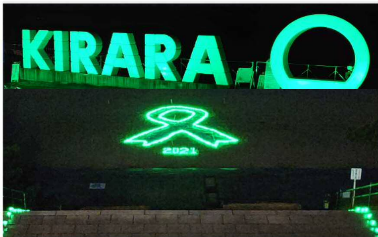
道の駅 キララ多伎 (KIRARAモニュメント・キララビーチ) 10月16日